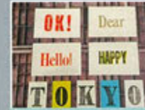
* PRIMAL PRESS +ADAN

英国のヴィンテージ活版印刷機と活字を使ったステーションリーブランド。ブラック・レターにこだわったタイポグラフィが特徴です。