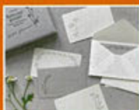
Hütte paper works