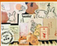
長谷川印刷 活版部