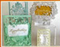
nekonekodesign PAPER ARTS