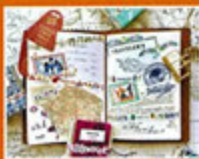
Pavillo / HARULABO