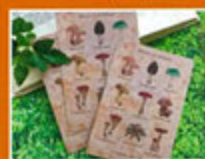
nemunoki paper item