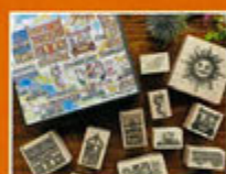
ありさ&あかめがね