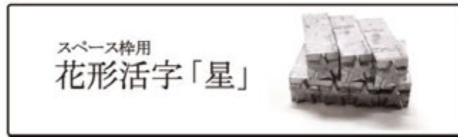
花形活字「星」バージョン